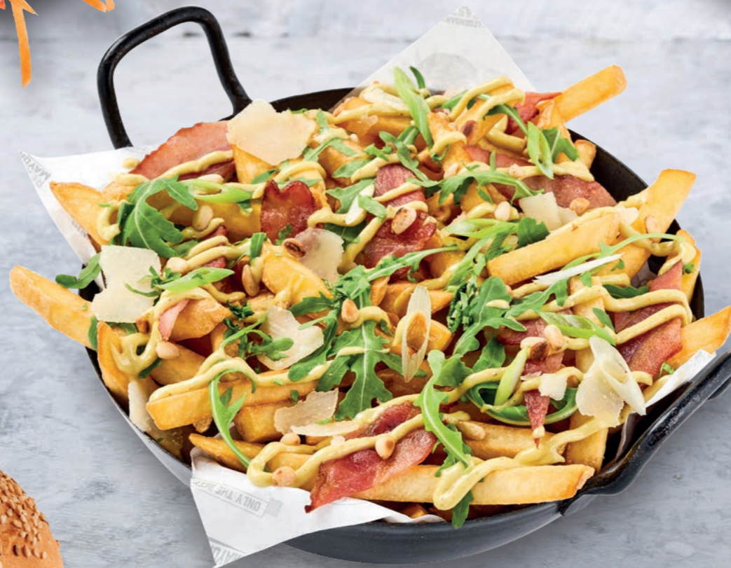
LOADED GREEN PESTO FRIES