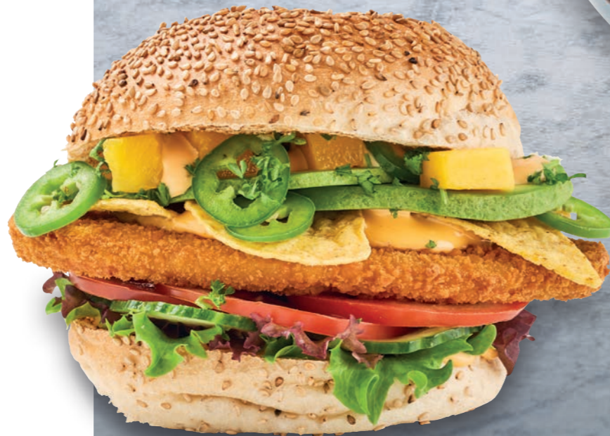
GARLIC SRIRACHA BURGER