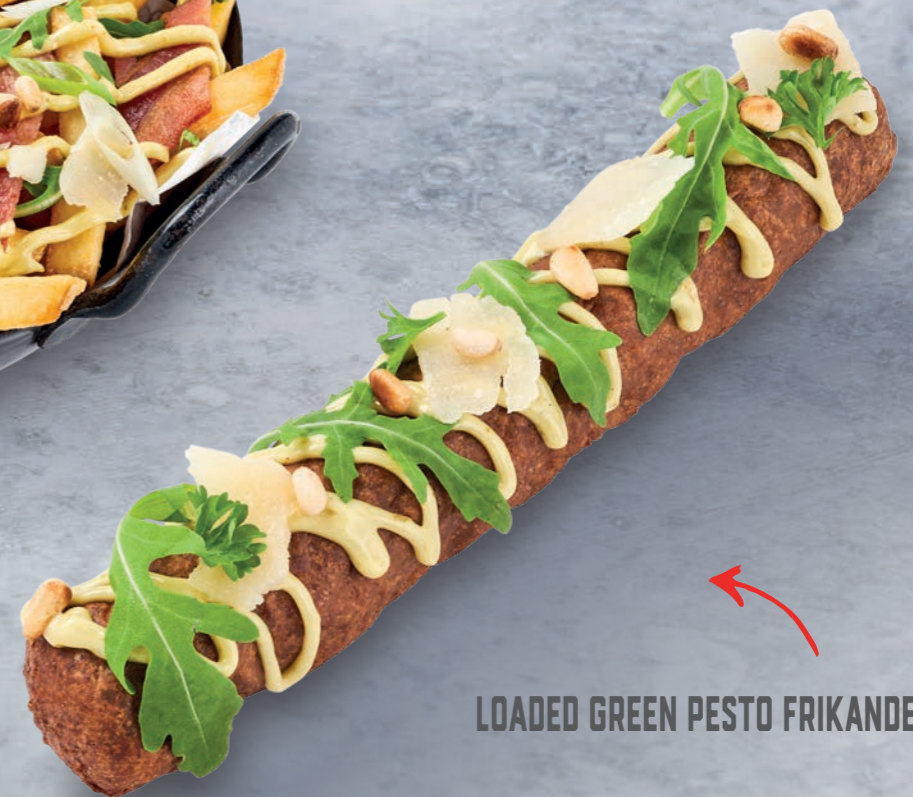
LOADED GREEN PESTO FRIKANDEL