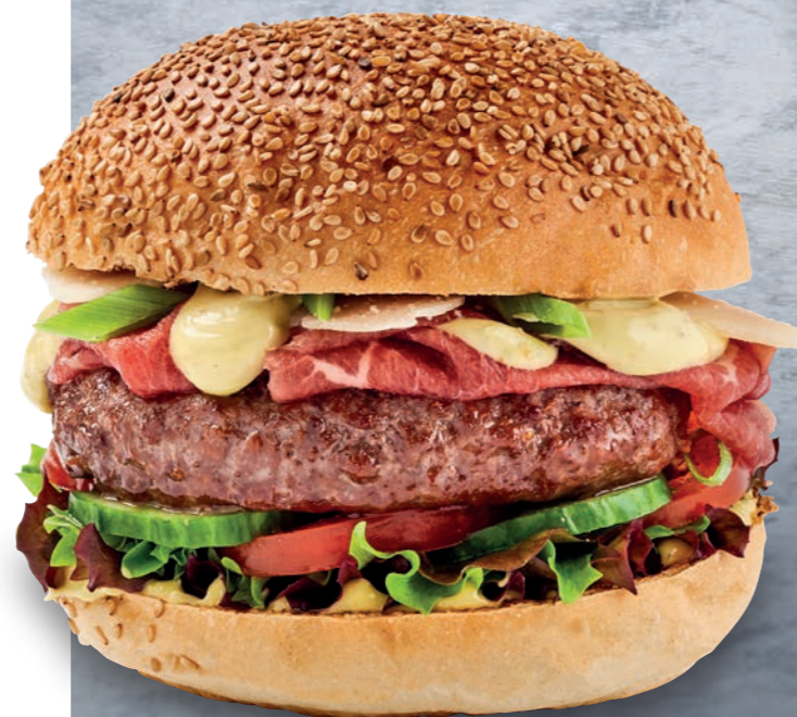
GREEN PESTO BURGER