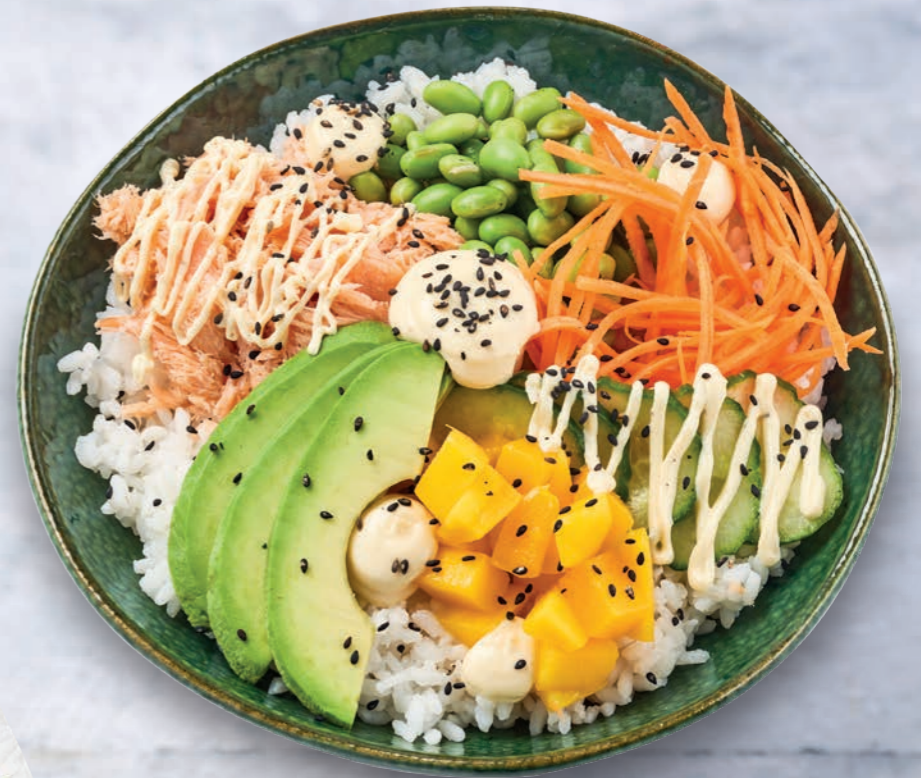
LEMON PEPPER POKÉBOWL