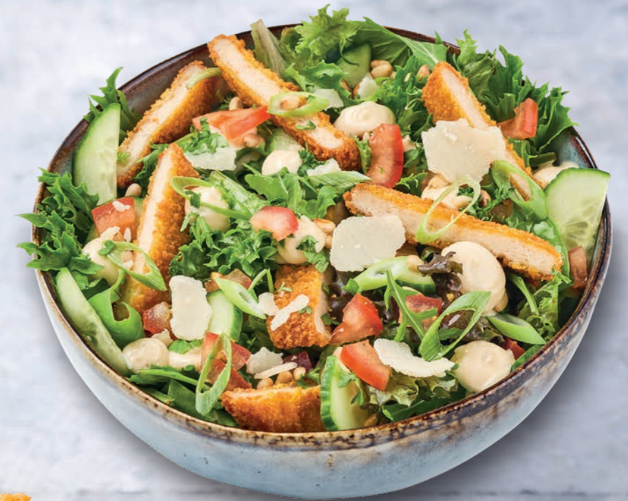
SALADE MET KROKANTE KIPBURGER EN BLACK TRUFFLE MAYONNAISE