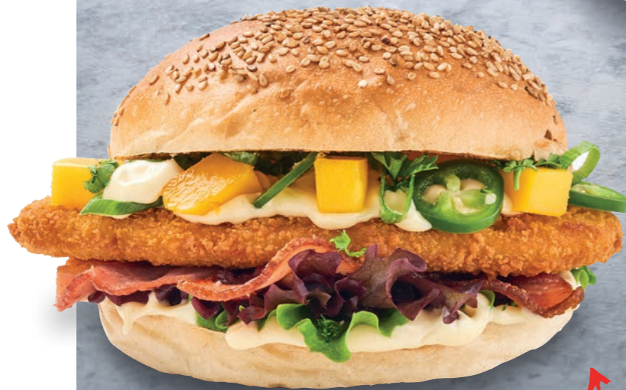
CRUNCHY LEMON PEPPER BURGER