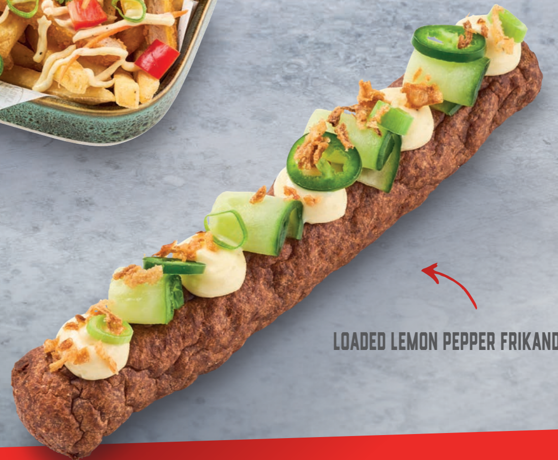
LOADED LEMON PEPPER FRIKANDEL