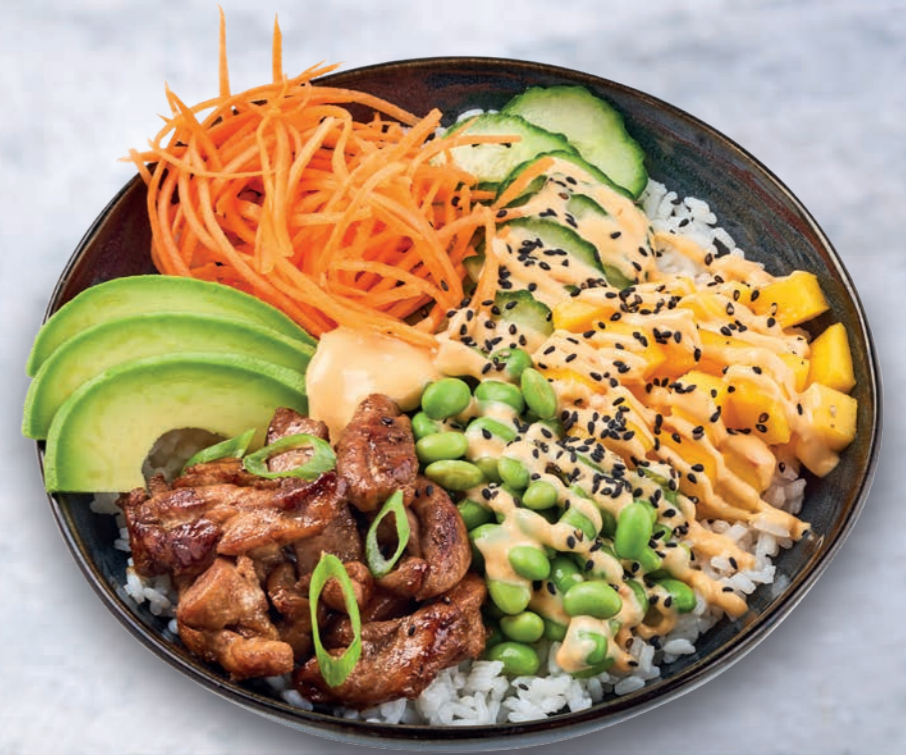
GARLIC SRIRACHA POKEBOWL