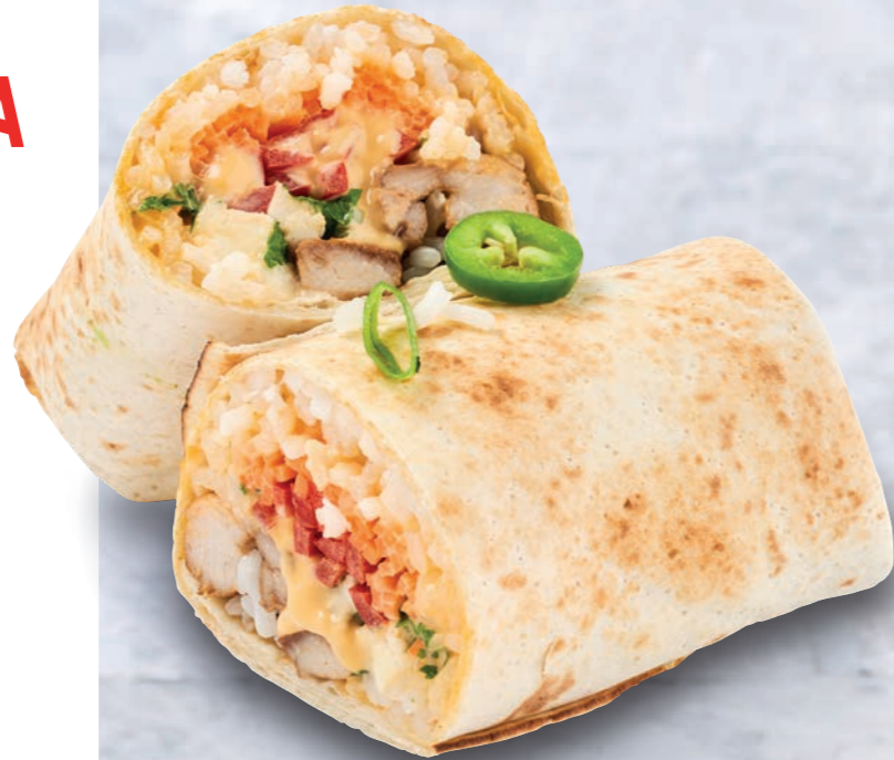
GARLIC SRIRACHA BURRITO

Een pittige mayonaisse met een vleugje knoflook. Sriracha is dé smaaksensatie uit Thailand: een pittige chilisaus uit gefermenteerde rode pepers. Gecombineerd met de romigheid van mayonaisse en een vleugje knoflook ontstaat een subtiel pittige smaak.