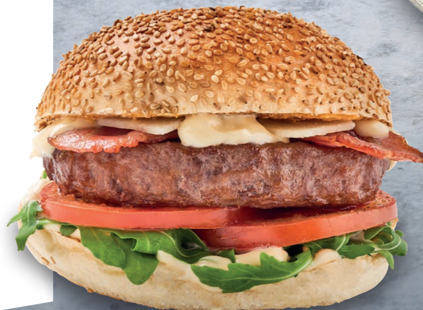
BLACK TRUFFLE BURGER