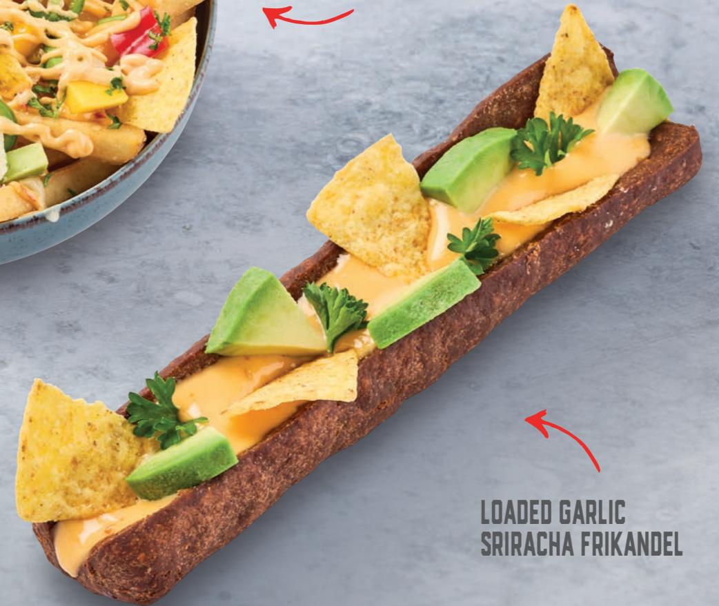
LOADED GARLIC SRIRACHA FRIKANDEL