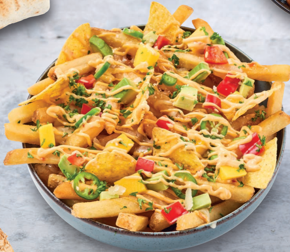
LOADED GARLIC SRIRACHA FRIES