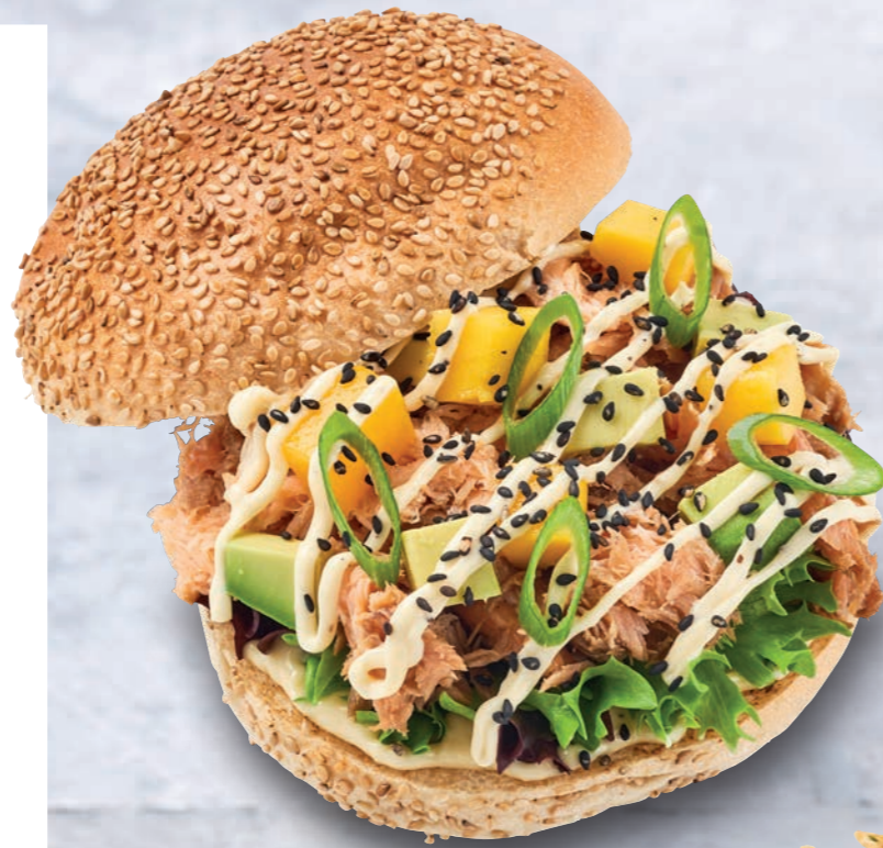
LEMON PEPPER SALMON SANDWICH

Een lekker frisse en tegelijk romige mayonaisse. De bereiding met verse lemongepuree en crushed black pepper zorgt voor een verrassend frisse en hartige noot.