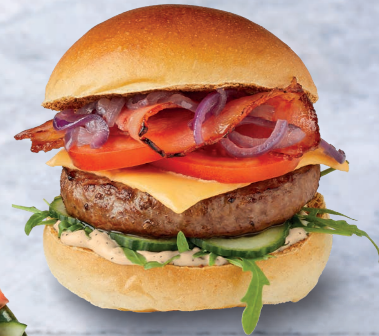
CRUSHED PEPPER BURGER