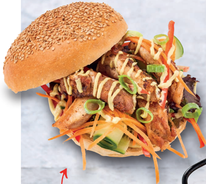
BROODJE KIP MET GREEN PESTO MAYONNAISE

Een romige en frisse mayonaisse, bereid met verse pesto, die glutenvrij en vegetarisch is. De pijnboompitten en kaas geven de mayonaisse een lekker hartige smaak.