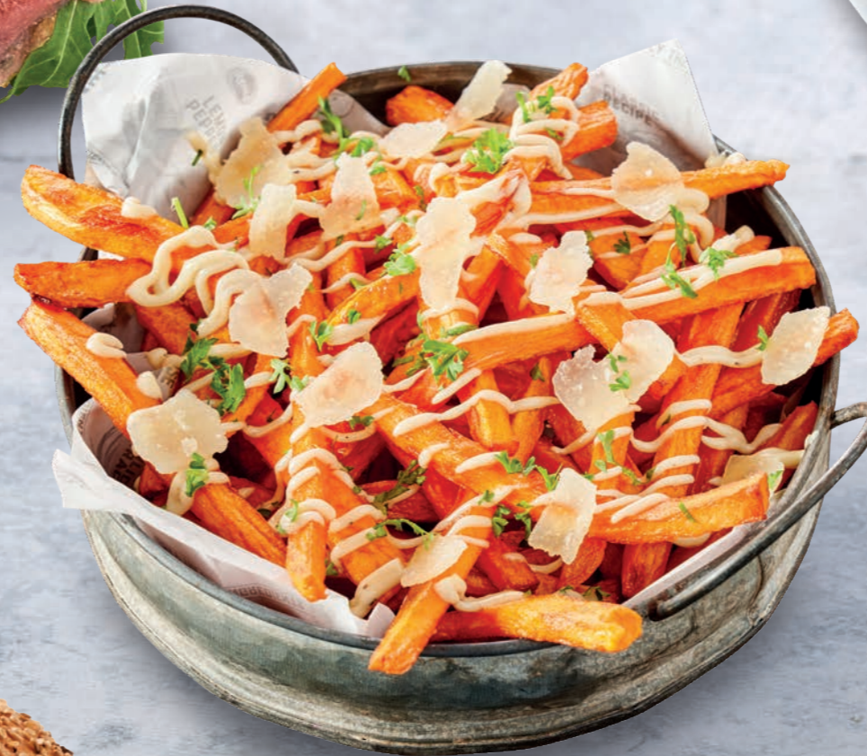
LOADED SWEET POTATO FRIES