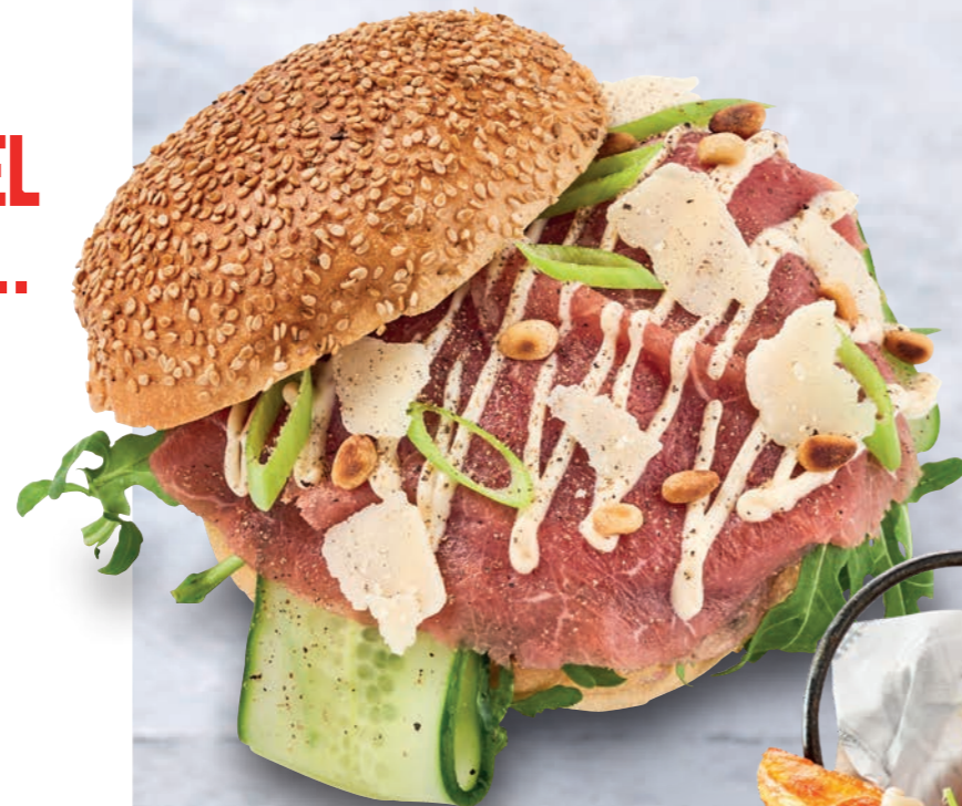
BROODJE CARPACCIO MET BLACK TRUFFLE MAYONNAISE

Een romige mayonaisse met de kenmerkende smaak van kerrie. De toevoeging van chili geeft een licht pittige twist aan deze mayonaisse.