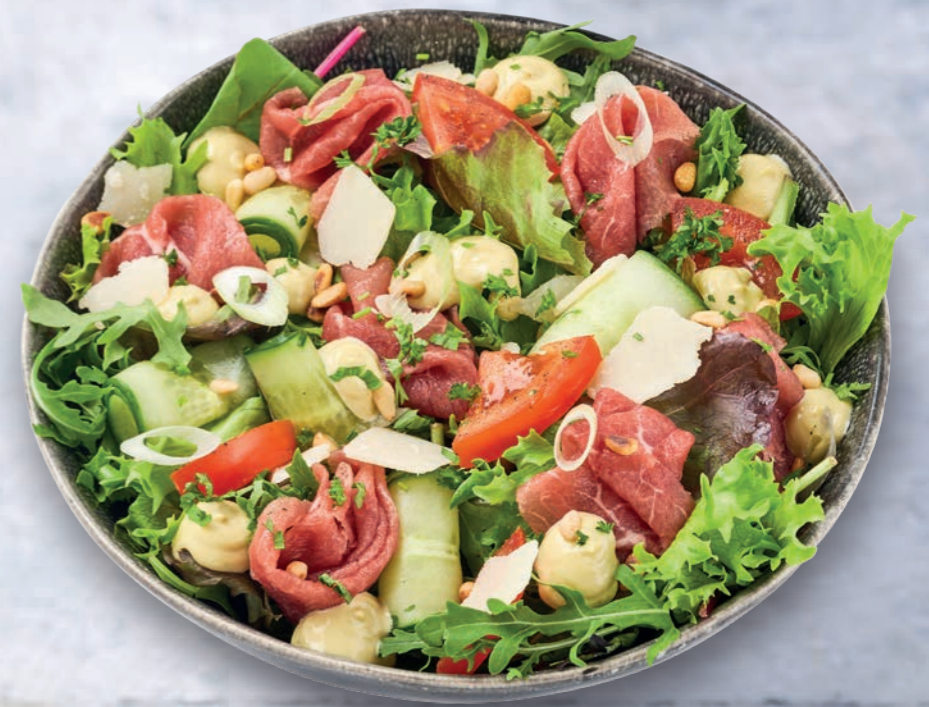
CARPACCIO SALADE MET GREEN PESTO MAYONNAISE