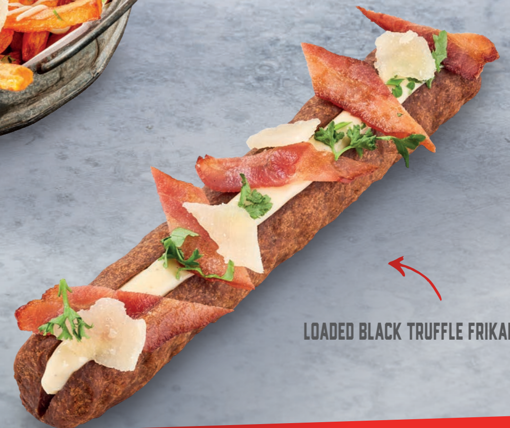
LOADED BLACK TRUFFLE FRIKANDEL