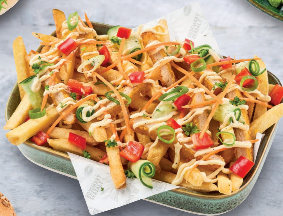
LEMON PEPPER LOADED FRIES